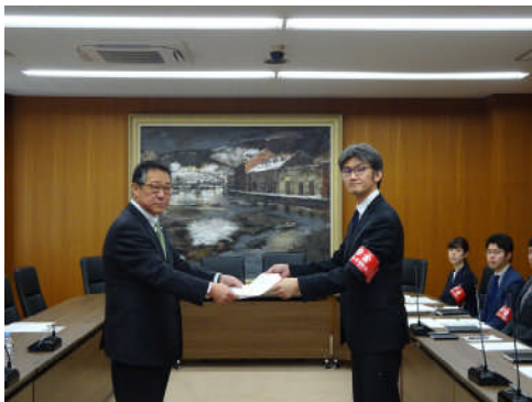
《北海道労組・団体交渉の様子》

できる環境を作り上げるために、全道の組合員・全国の仲間と共に、最後まで粘り強く闘い抜きます。共に頑張りましょう！