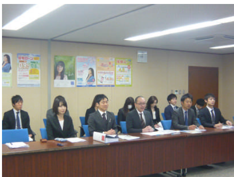
《北陸労組・団体交渉の様子》

労金業態で働くすべての労働者の労働条件の改善をめざし、全国の仲間とともに最後まで闘い抜くことを誓います。ともに頑張りましょう！