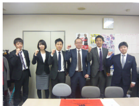
《北陸労組・交渉メンバー》